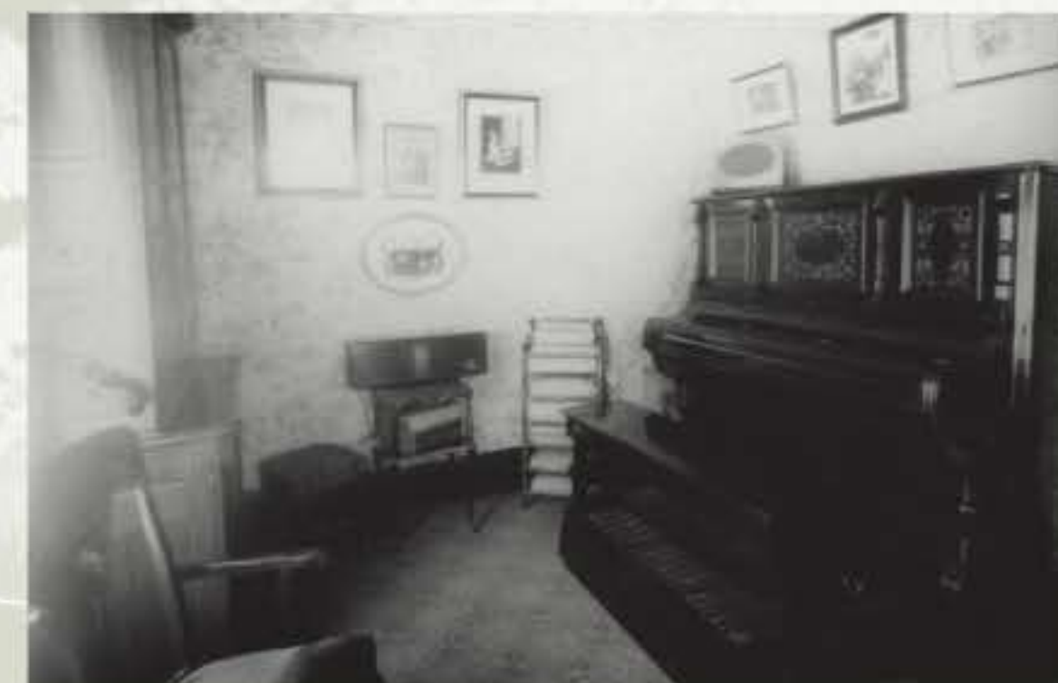
Le boudoir de la villa Casavant.